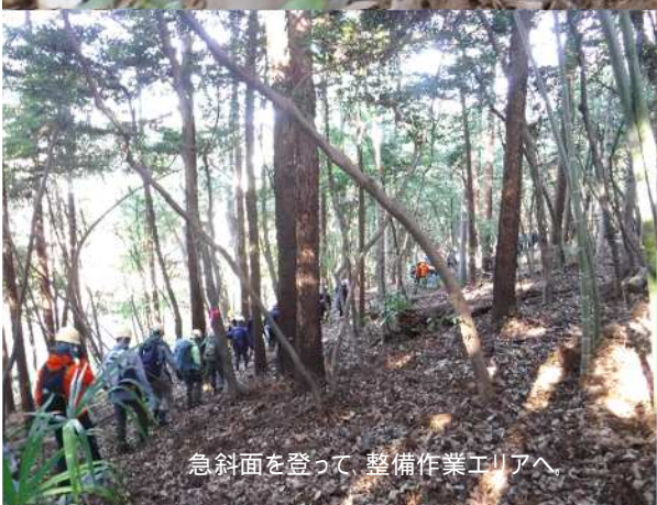
急斜面を登って 整備作業エリアへ

共催 (公財) かながわトラストみどり財団 相模原市 (公財) 相模原市まち・みどり公社